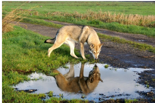
l'impression que fait celle d'un loup

TETE : La tête doit rappeler l'impression que fait celle d'un loup et correspondre harmonieusement dans ses dimensions avec le corps. Vue de dessus et de profil, la tête a la forme d'un coin. La ligne qui va du museau à l'arcade zygomatique bien développée est très caractéristique. Conjointement à la forme adéquate et la position des yeux, cette ligne donne l'aspect recherché semblable à celui d'un loup.