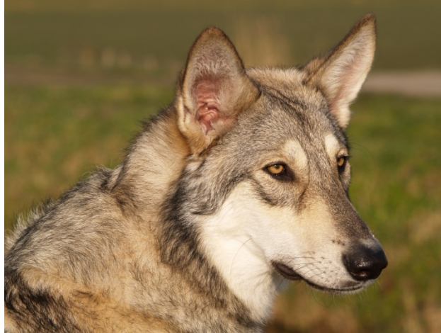
forme typique semblable à celle du Loup

Museau : Vu de profil il n'est pas trop descendu et légèrement en forme de coin. Vu de dessus, il va en s'amenuisant légèrement et est harmonieusement rempli sous les yeux. Un museau trop grossier altère la forme typique semblable à celle du Loup.