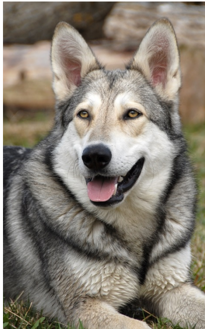
une belle collerette

En hiver, surtout grâce au poil de saison, le cou peut s'orner d'une belle collerette.