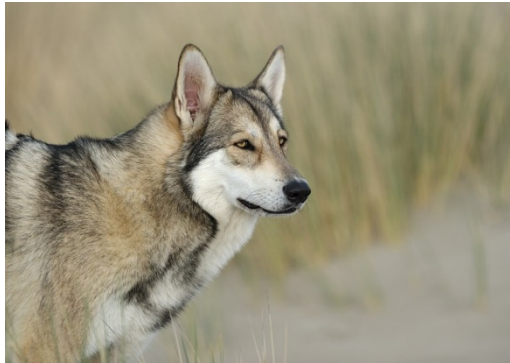
sans heurt avec le poitrail

COU : Sec et bien musclé ; il se fond en ligne harmonieuse avec le dos ; de même, la ligne de la gorge se fond sans heurt avec le poitrail.