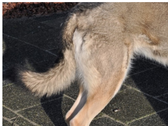
ou en forme de sabre