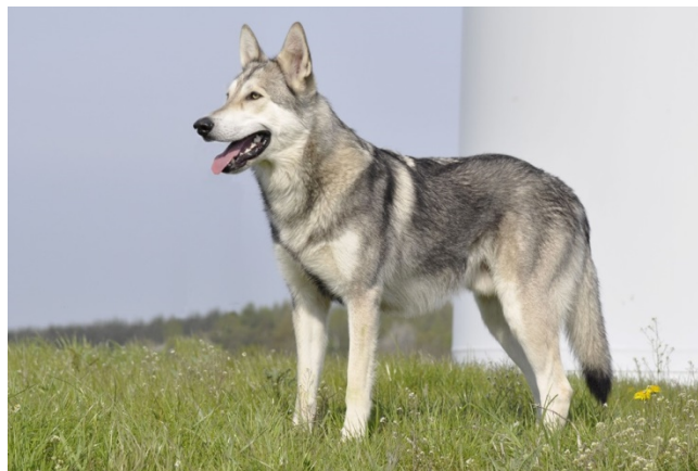
angle normal entre l'omoplate et le bras

Bras : De même longueur que l'omoplate. Angle entre l'omoplate et le bras normal, pas exagéré.