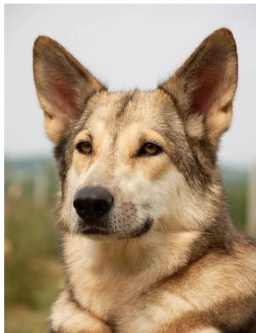
attachées à hauteur de l'oeil

leur face interne est couverte de poil. Les oreilles sont attachées à hauteur de l'oeil. Elles sont très mobiles et expriment l'humeur et les émotions du chien.