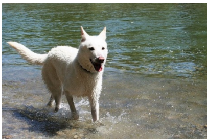
blanc ou blanc-crème

Couleur: Les couleurs vont du sable au fauve charbonnés (poil de sanglier, poil de lièvre), dit « gris-loup » et du sable au fauve charbonnés de marron. Les marques typiques du Loup sont de couleur blanc-crème clair à blanc. Ces marques claires caractéristiques du Loup s'étendent à la région inférieure du corps, la face interne et la région postérieure des membres, les culottes et sous la queue. La pigmentation de la truffe, du bord des paupières, des lèvres et des ongles doit être noire chez le Chien-loup de Saarloos « gris- loup », et le sujet blanc. Elle doit être de couleur foie chez le sujet marron et blanc-crème. A la face externe des membres, aussi bien le sujet « gris-loup » que le sujet marron présentent un poil de couleur plus foncée. Ils devraient aussi avoir un masque qui souligne l'expression.