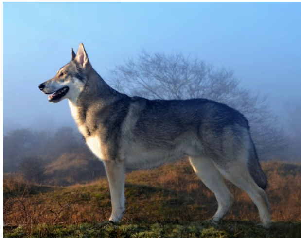
plus long que haut

PROPORTIONS IMPORTANTES : Le Chien-loup de Saarloos est plus long que haut. Le rapport entre la longueur du museau et celle du crâne est de 1 : 1.