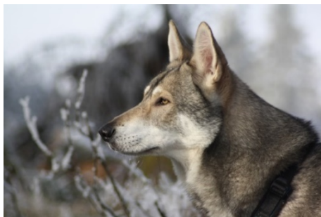
la dépression naso-frontale est peu marquée

Stop : La dépression naso-frontale est peu marquée.