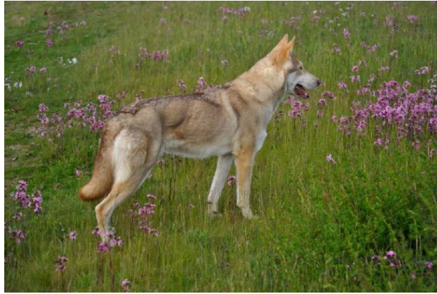
un chien de forte constitution

PROPORTIONS IMPORTANTES : Le Chien-loup de Saarloos est plus long que haut. Le rapport entre la longueur du museau et celle du crâne est de 1 : 1.