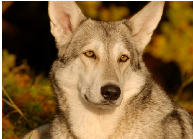
de couleur jaune, en forme d'amande

Yeux : De couleur jaune, en forme d'amande, placés légèrement obliquement, pas proéminents ni ronds, les paupières étant bien appliquées sur le globe oculaire.