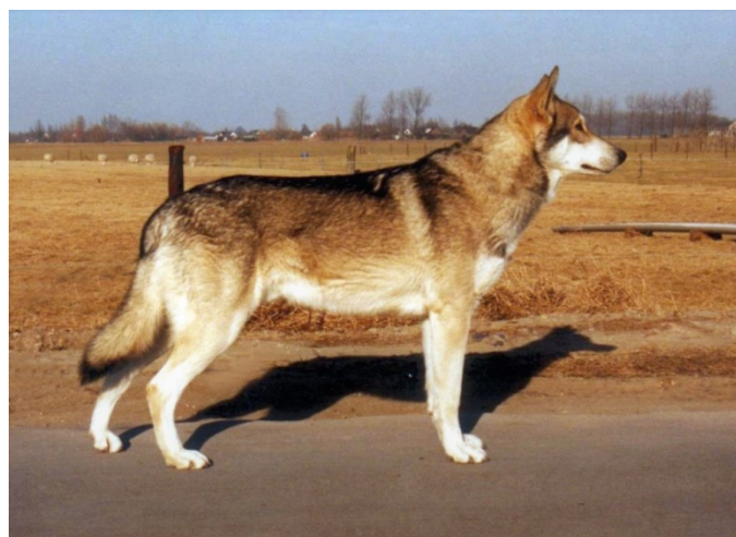
le bassin donne souvent l'impression d'être plus oblique

Les angles des postérieurs sont en harmonie avec ceux des antérieurs. Les allures légères typiques de la race dépendent dans une grande mesure de la bonne angulation du grasset et du jarret. Le moindre écart empêche le déroulement de ce mouvement typique. Chez le chien en station, les jarrets légèrement clos sont autorisés.