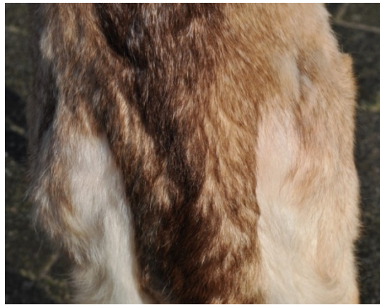
large à sa naissance

QUEUE : Elle est large à sa naissance et abondamment pourvue de poils ; elle atteint au moins le niveau du jarret. Elle semble attachée un peu bas, fait qui est souvent accentué par une légère dépression près de l'attache. La queue est portée légèrement en forme de sabre à presque entièrement droite. Quand le chien est excité ou au trot, elle peut être portée plus haut.