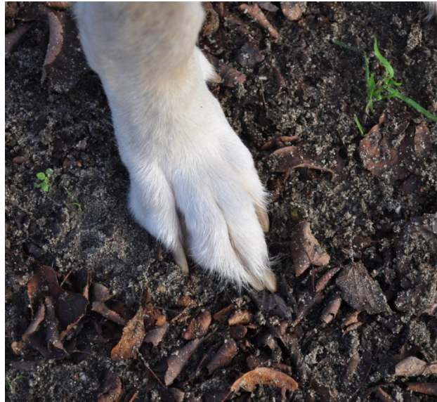
pieds de lièvre

Pieds antérieurs : Pieds de lièvre, bien musclés et cambrés, avec des coussinets fortement développés. En station, un pied légèrement tourné vers l'extérieur est admis.