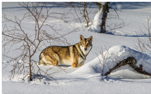
pelage en hiver

En hiver, c'est généralement le sous-poil qui est prédominant ; avec le poil de couverture il forme une fourrure abondante qui couvre tout le corps et dessine autour du cou une collerette bien définie. En été, c'est le poil de couverture qui prédomine sur tout le corps. Des différences de température en automne et en hiver peuvent exercer une grande influence sur le sous-poil ; mais la prédisposition à former du souspoil doit au moins être présente. Il faut que le ventre, la face interne des cuisses et aussi le scrotum soient recouverts de poil.