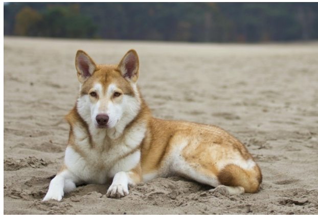
pelage en été

Poil : Le pelage est différent en été et en hiver.