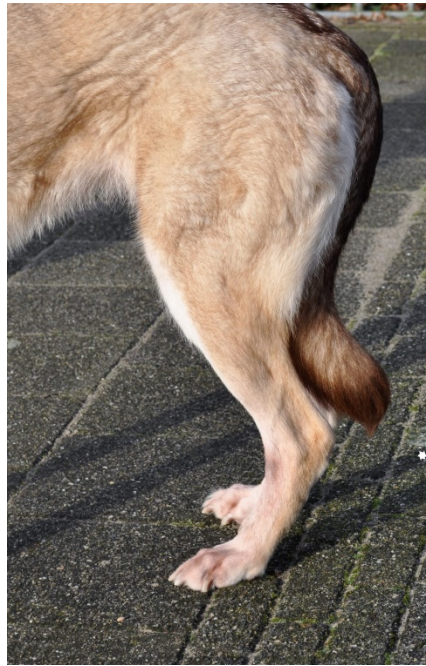
cuisse normale, bien muclée

Cuisse : De longueur et largeur normales, bien musclée.