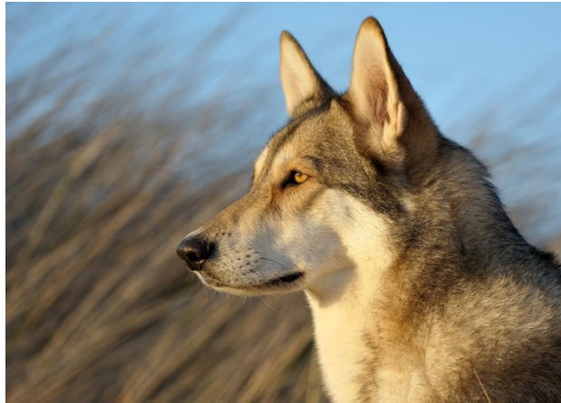
ressemblance avec le loup

de l'oeil. Chez le sujet plus âgé, la couleur jaune de l'oeil peut devenir plus foncée, mais le ton jaune d'origine persiste à travers elle. La couleur brune est un défaut.