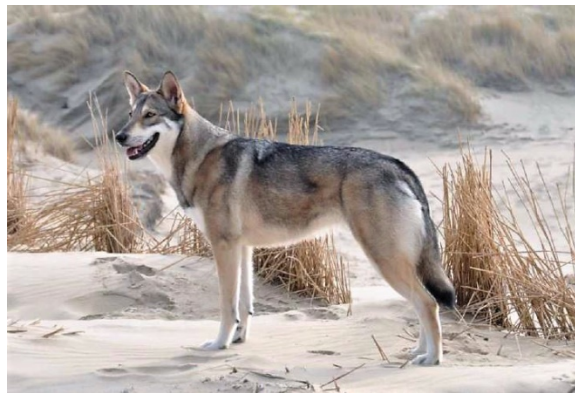
portée presque entièrement droite