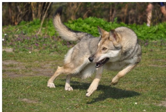
chien vif et débordant d'énergie

COMPORTEMENT / CARACTERE : Chien vif et débordant d'énergie, faisant preuve d'un caractère fier et indépendant. Il a la réputation d'obéir avant tout de sa propre et libre volonté. Il est attaché à son maître et est extrêmement fiable. Il peut se montrer réservé envers les étrangers et ne recherche généralement pas le contact. L'attitude réservée et semblable à celle du Loup pour éviter les situations inconnues est typique du Chien-loup de Saarloos.