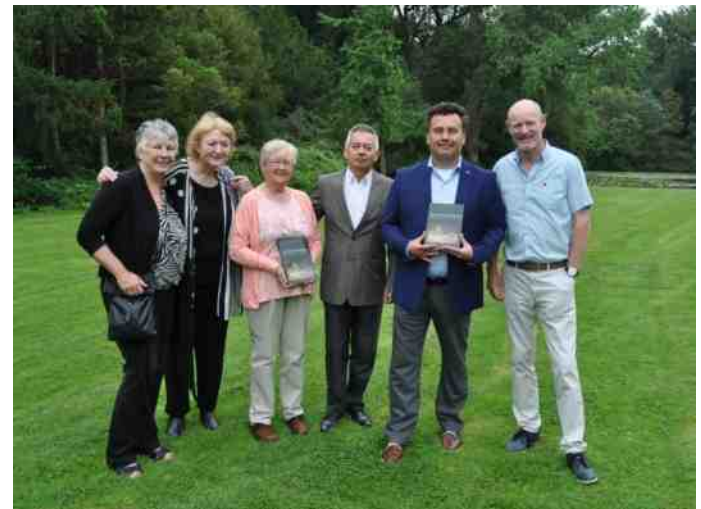
even poseren na de uitreiking