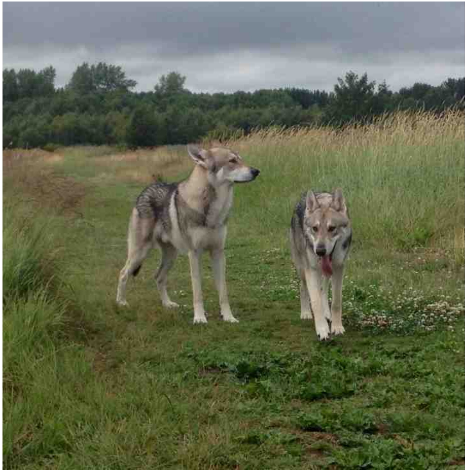
Thorgal met zoonlief Aegir

In het kader van bezuinigingen en leuk voor de wandelaars, zijn echter in Rotterdam overal de hoveniersbedrijven verdwenen en de schaapskuddes verschenen. Over het algemeen wel met een bordje (op 1 meter afstand van de daadwerkelijke kudde; handig!) en