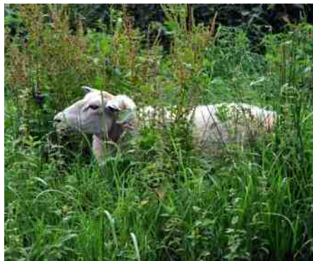
de witte tornado

Er lopen ook konijnen en kippen los en ik heb de grootste moeite 2 hyperende honden in bedwang te houden. We leggen ze ergens vast aan een paal en ik ga er maar naast op de grond zitten. Robbert verdwijnt uit zicht.