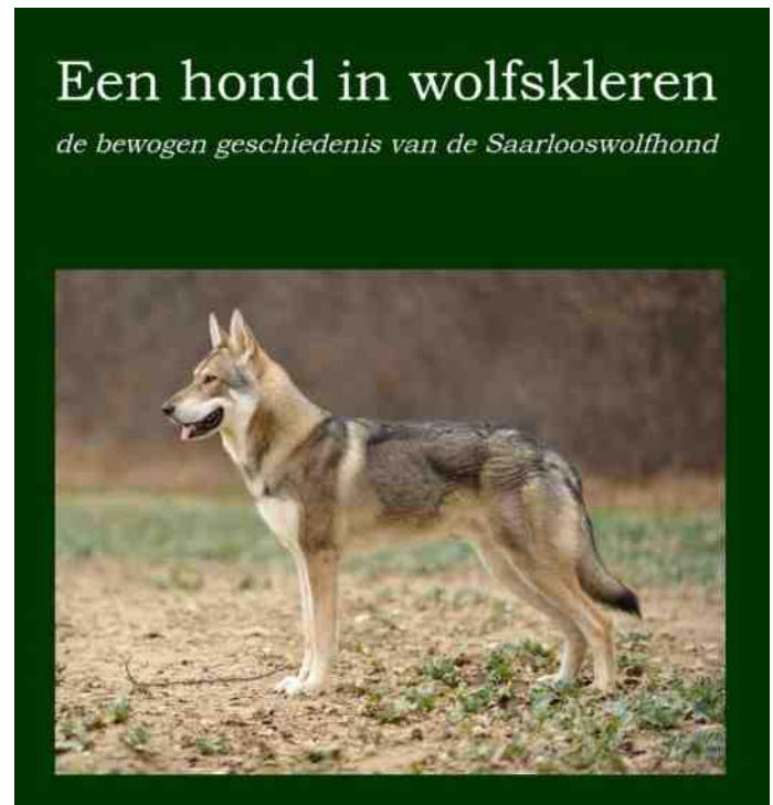
nieuw boek over de Saarlooswolfhond

Bestellen kan uitsluitend op: www.eenhondinwolfskleren.nl