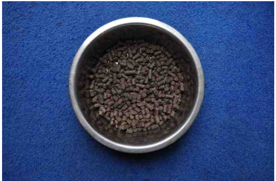
saai, die dagelijkse bak voer

Voedsel zoeken is voor een dier een doel op zich en heeft een belonende waarde in zich. Je kunt je bedenken