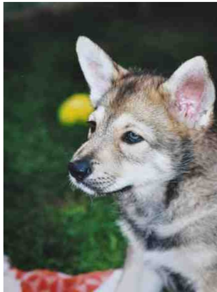
Helleveegje, juni 2001, Drenthe