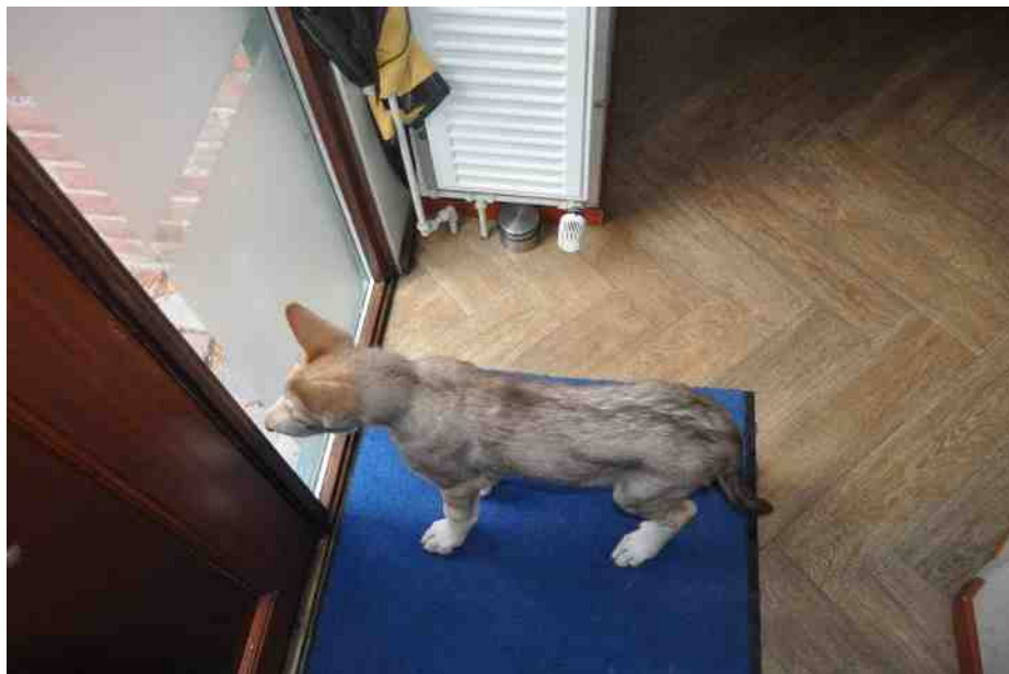
baasje, waar ben je?

"Een Saarlooswolfhond kan nooit alleen zijn. Hij sloopt in een oogwenk al je spulletjes en huilt daarna de hele buurt bij elkaar." We kennen die verhalen natuurlijk, maar het is onzin. Een Saarlooswolfhond kan best een paar uurtjes alleen zijn. Dat gaat echter niet van de ene op de andere dag. Het vergt veel tijd, aandacht en volharding en zoals altijd: respect voor het karakter van ons ras.