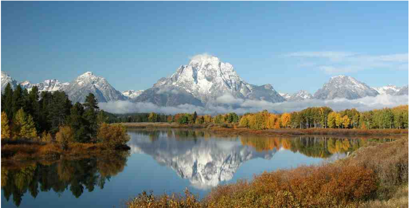
Yellowstone Park, jachtgebied van wolven in Noord-Amerika

Het leerproces van de jacht gaat door bij de jonge wolven die we volgen in het Yellowstone Park, het oudste nationale park ter wereld. Het is met bijna 9000 km 2 ook een van de grootste nationale parken in de Verenigde Staten. De jonge wolven moeten leren dat niet elk dier een gemakkelijke prooi is. Een bizon is heel anders dan een vette zalm of een wapiti, op de eland na het grootste hert van Noord-Amerika.