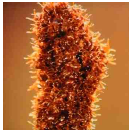
duizenden teken op een rietstengel