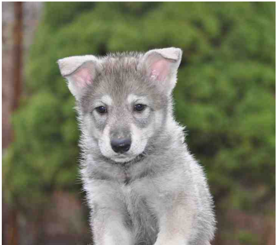
Dune van de Zevenhuizerplas