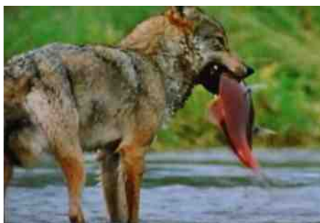
zalm als prooi

Andere dieren vereisen een andere jacht tactiek, zoals rode zalmen. Sommige soorten zwemmen wel 1400 kilometer naar hun paaigebied op 2100 meter boven de zeespiegel. Jonge wolven moeten ook de jacht op zalm onder de knie krijgen. Met zo'n enorme hoeveelheid zalm in de ondiepe rivieren zou dit eigenlijk doodsimpel moeten zijn, maar dat is niet zo. Jonge wolven moeten met vallen en opstaan deze techniek aanleren. Een ervaren, volwassen wolf kan wel 20 zalmen per uur vangen! Het is de perfecte prooi: ongevaarlijk, makkelijk te vangen en rijk aan vet en eiwitten.