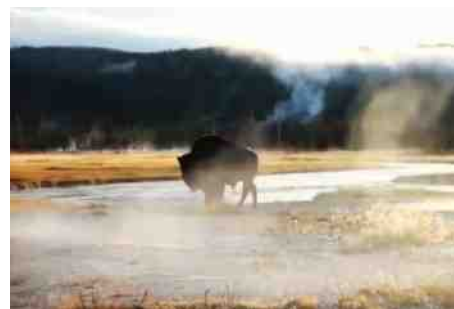
bizon in yellowstone park