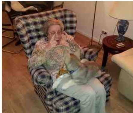
Dune aan het werk