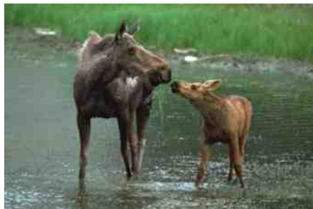
Eland met kalf

een kalf is een gezonde, volwassen eland te gevaarlijk voor ze. Dat wordt anders als de roedel een verzwakte eland vinden. Bijvoorbeeld een dier dat verzwakt is door teken. Op één eland kunnen wel 200.000 teken leven die allemaal bloed zuigen. Wolven zijn