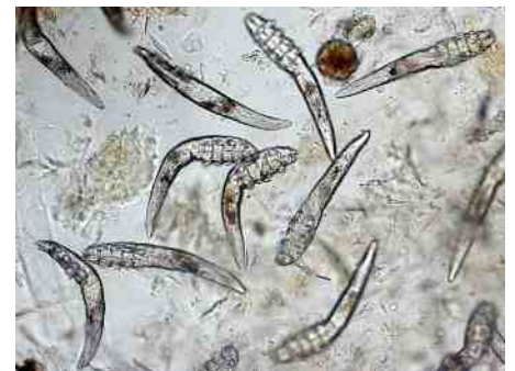
demodex onder de microscoop

fen, is het zeker geen demodex. Voor de behandeling moet eerst de weerstand van de hond worden verbeterd. De mijten worden daarna met zeer giftige middelen gedood. De behandeling mag pas worden gestopt wanneer geen levende mijten of eitjes meer in de huid aanwezig zijn.