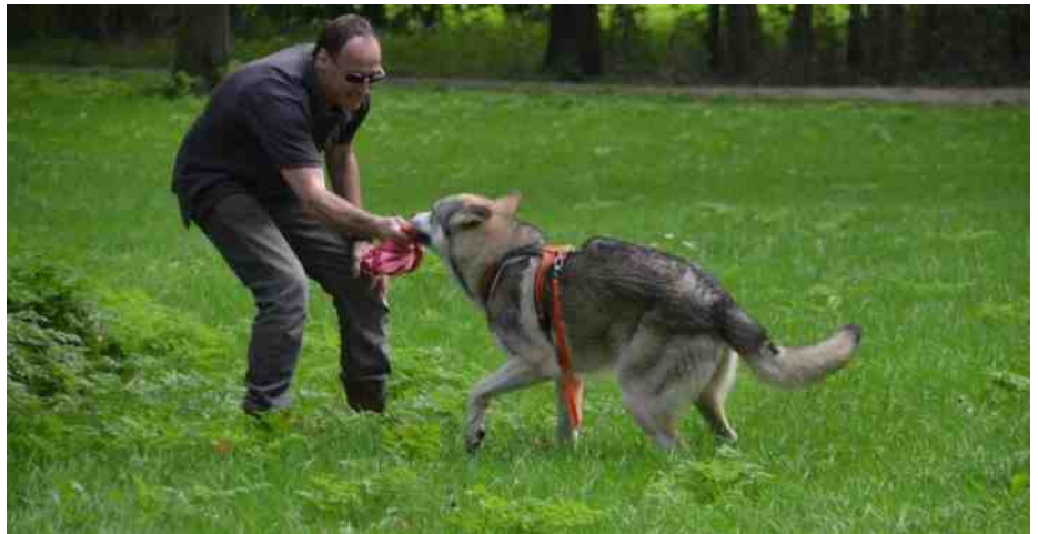
wie wint dit spelletje?

Maar vandaag waren we geweldig. Of Thorgal in het bijzonder, want ik deed het eigenlijk verkeerd. De juf had namelijk gezegd om VOOR de bramenstruiken naar links te gaan. Dat had ik wel gehoord, maar er waren overal bramenstruiken om mij heen dus dit was best lastig. Ik liep in het gras langs het water met aan mijn linkerzijde bramenstruiken. Na een 100 tal meters begon ik me wat zorgen te maken,