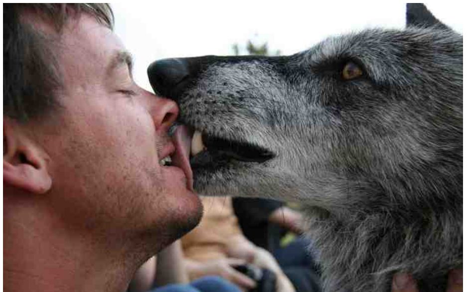
begroeting door een oude wolf