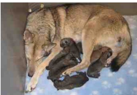
Lica met haar pups

Lica Kadin van de Kilstroom heeft op maandag 1 december 2014 zeven pups ter wereld gebracht. Het waren 3 teefjes en 4 reutjes. Van de reutjes was er 1 bosbruin, alle andere pups waren wolfsgrauw. De vader is Chumanis