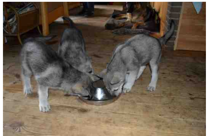
de drie outcrosspups

Vijf Saarlooswolfhonden werden in het verslagjaar herplaatst. Caira, Miele, Django, Seven en Katara vonden bij hun nieuwe baasjes een liefdevol nieuw onderkomen.