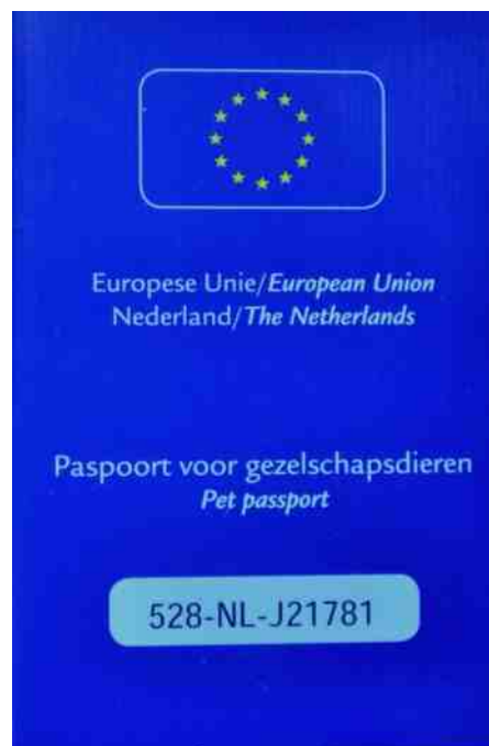
het nieuwe EU paspoort

Deze drukkers mogen de paspoorten alleen afgeven aan in Nederland geregistreerde dierenartsen en moeten registreren welke paspoortnummers zijn afgeleverd. Een paspoort kan alleen via de dierenarts verstrekt worden aan de eigenaar.