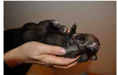
op de rug

hersenen een levenslang effect heeft. Sommige pups zullen zich tijdens de oefeningen verzetten, andere weer niet. In ieder geval moeten de oefeningen steeds nauwgezet en voorzichtig worden uitgevoerd. Niet meer dan eenmaal per dag en nooit langer dan 3 tot 5 seconden per oefening. Over-