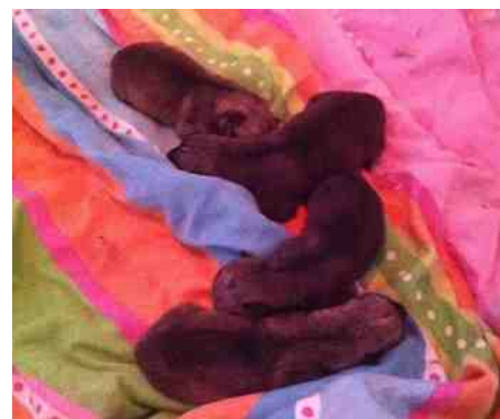
de pups van Namtar

Baka Inu Naughty Namtar heeft op maandag 8 december 2014 vier pupjes geworpen bij Nathalie Mol in de kennel Baka Inu van Esther Siteur-van Rijnstra. Het werden 2 teefjes en 2 reutjes, allen wolfsgrauw. De vader is Zohey Zeger Zenit Bastaja. Namtar is een goede moeder. De geboortegewichten varieerden van 295 tot 350