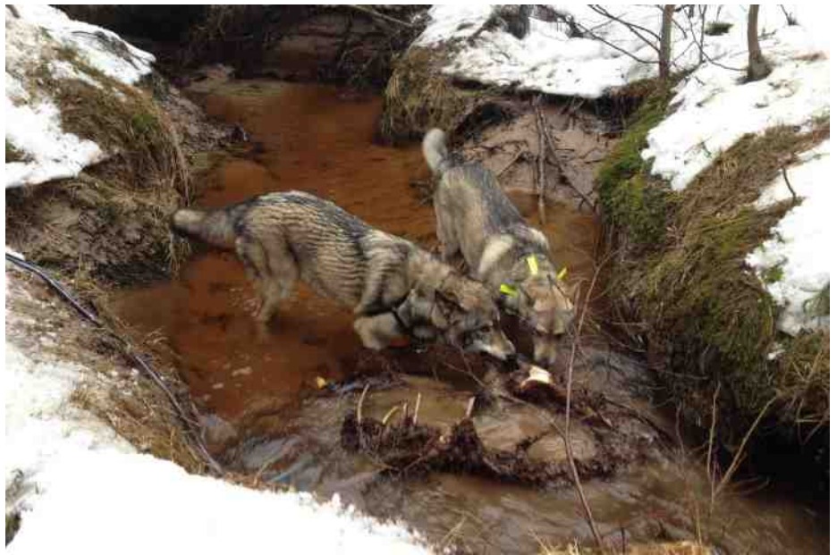
smullen van een elandkarkas

De bus van vier bij twee meter zou de komende acht maanden ons onderkomen zijn. Het aanpassingsvermogen van de honden was geweldig. In de bus heeft elke hond zijn eigen plek. Een houtkachel heeft de ergste kou buiten gehouden. Terwijl we onze blokhut zonder machines bouwden, lagen de honden te genieten van de zon en de vrijheid. Elke dag maakten we mooie tochten met ze, ook al wilden we graag opschieten met het huis. Nu zijn we alweer ruim een jaar verder en is het huis bijna af. We leven heel back to basic , dat wil zeggen geen stromend water en elektra van zonnepanelen. Een buiten badhuisje met ecotoilet. En heel decadent, we wassen ons met bronwater. De hamvraag is natuurlijk: wat doen jullie voor de kost? We verdienen vooral door te besparen, zelf