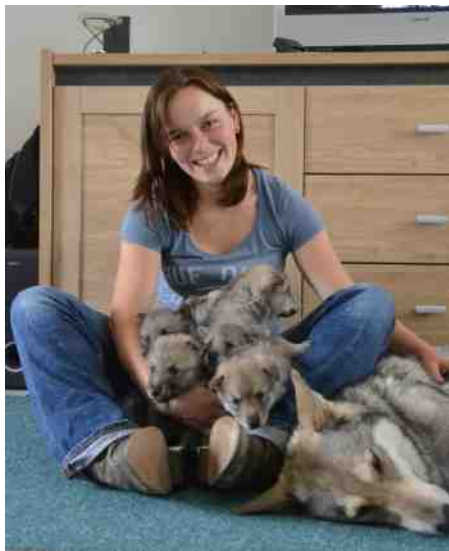
gelukkig met Bantu's pups