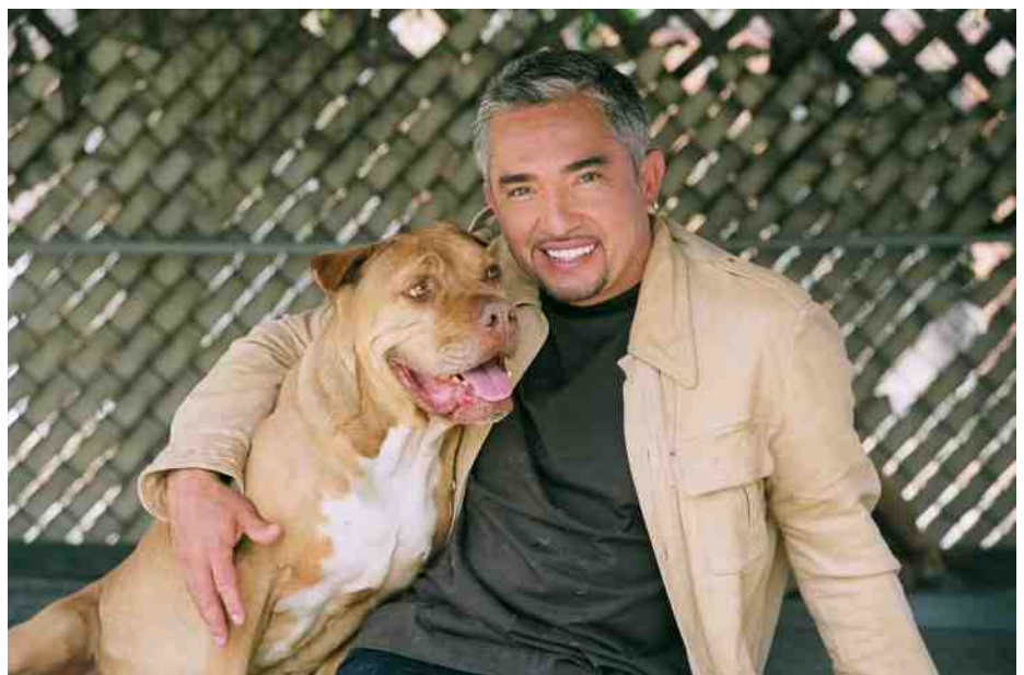
Cesar Millan met zijn geliefde hond Daddy

blik voorlichten over het gedrag van wolven en hun onverdiende reputatie van 'de grote boze wolf' wegnemen: 'Wolven zijn symbolen van de vrije natuur. Ze zijn tegelijkertijd ook het symbool van woeste, wilde beesten die grootmoeders opeten. De wolf is de voorvader van onze beste vriend, de hond. Misschien denken mensen daarom wel dat ze een wolvenwelpje moeten aanschaffen om een beter contact met de natuur te hebben. Maar zo werkt het niet,' zegt hij.