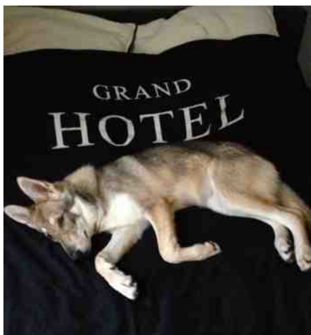
een echte stadshond

Dit soort rariteiten komen nu niet meer voor, ze heeft meer zelfvertrouwen gekregen. Wel ziet ze werkelijk álles wat er om haar heen gebeurt. Zelfs een net geplaatst makelaarsuithangbord op één hoog wordt nauwlettend bekeken, en ze staat er even voor still! "Hé, die hing hier normaal niet!" Ik ben dit van mijn vorige honden niet gewend. In Den Haag is het een ander verhaal.