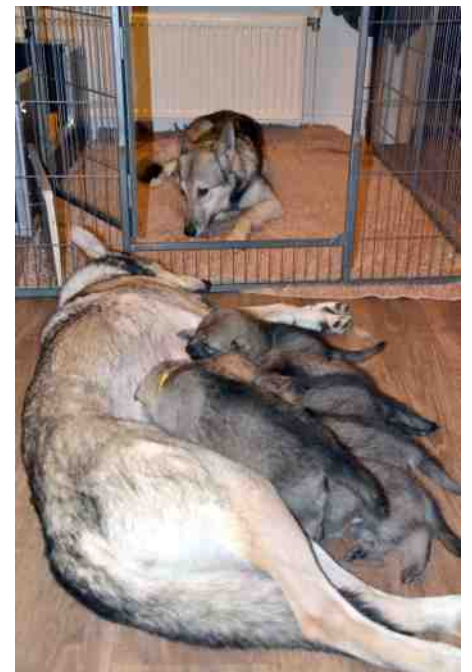
Rayén en Bantu met haar pups

kunnen de honden niet wennen en van het gehuil kunnen de burens last hebben. "Dat kun je de honden echt niet afleren."